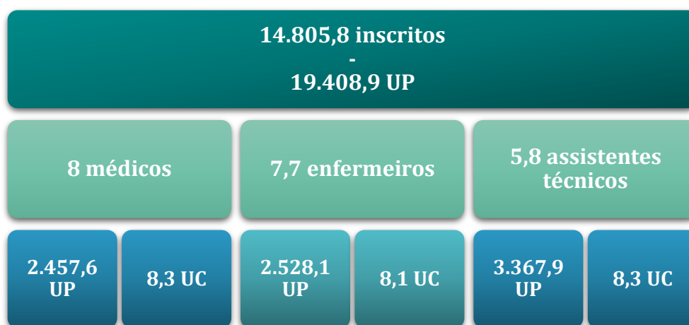
Figura 1: Caracterização da USF modelo B na ARSLVT

Em média, a USF modelo B da ARSLVT tem 14.806 utentes inscritos a que correspondem 19.408,9 UP. A equipa é constituída por 8 médicos, 7,7 enfermeiros e 5,8 assistentes técnicos (Figura 1).