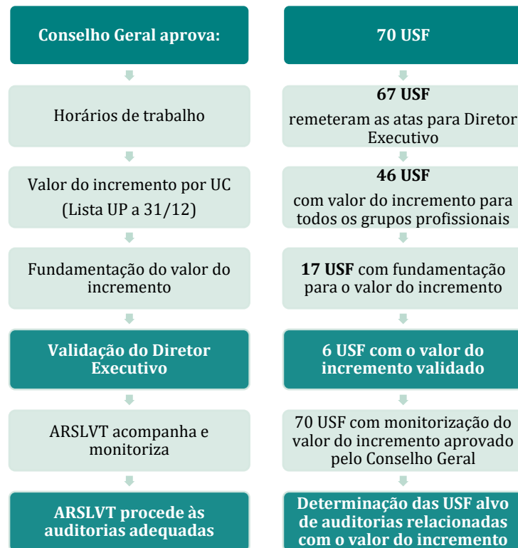
Figura 2: Procedimento de homogeneização dos critérios no ajuste dos horários das USF modelo B na ARSLVT

Os critérios utilizados para a monitorização da homogeneização de procedimentos foram os seguintes.